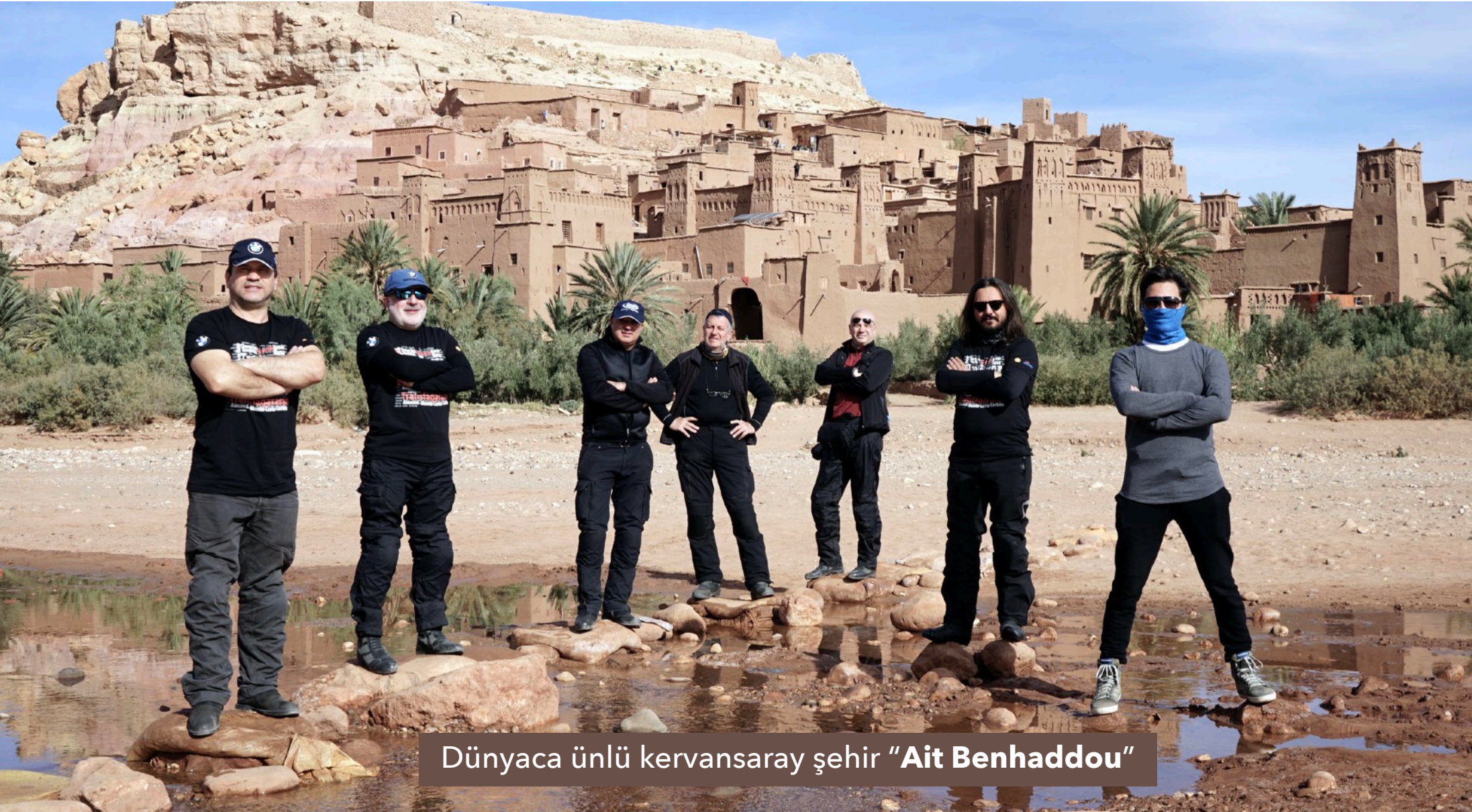
Dünyaca ünlü kervansaray şehir "Ait Benhaddou"