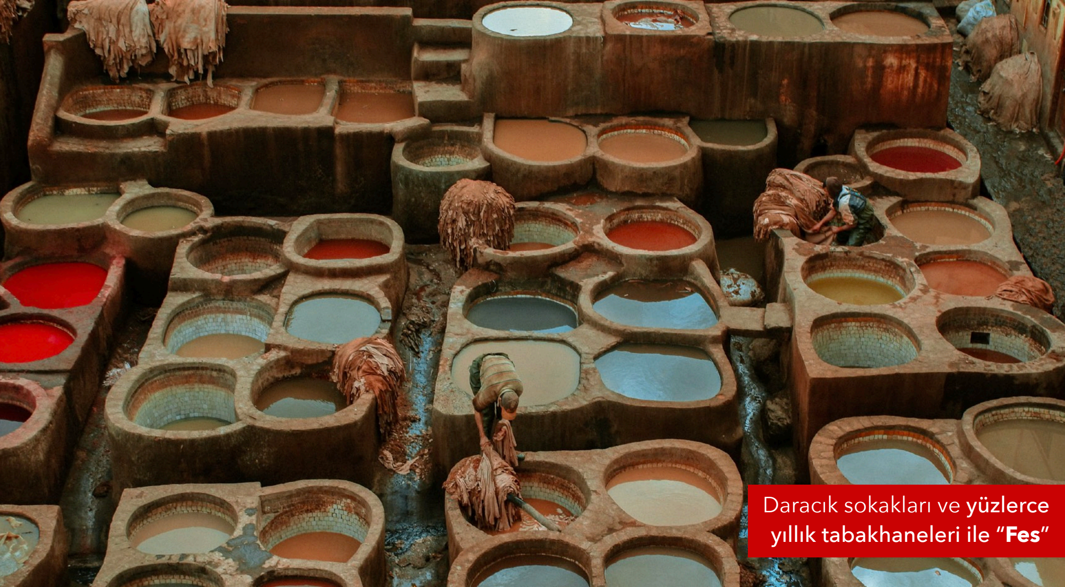
Daracık sokakları ve yüzlerce yıllık tabakhaneleri ile "Fes"